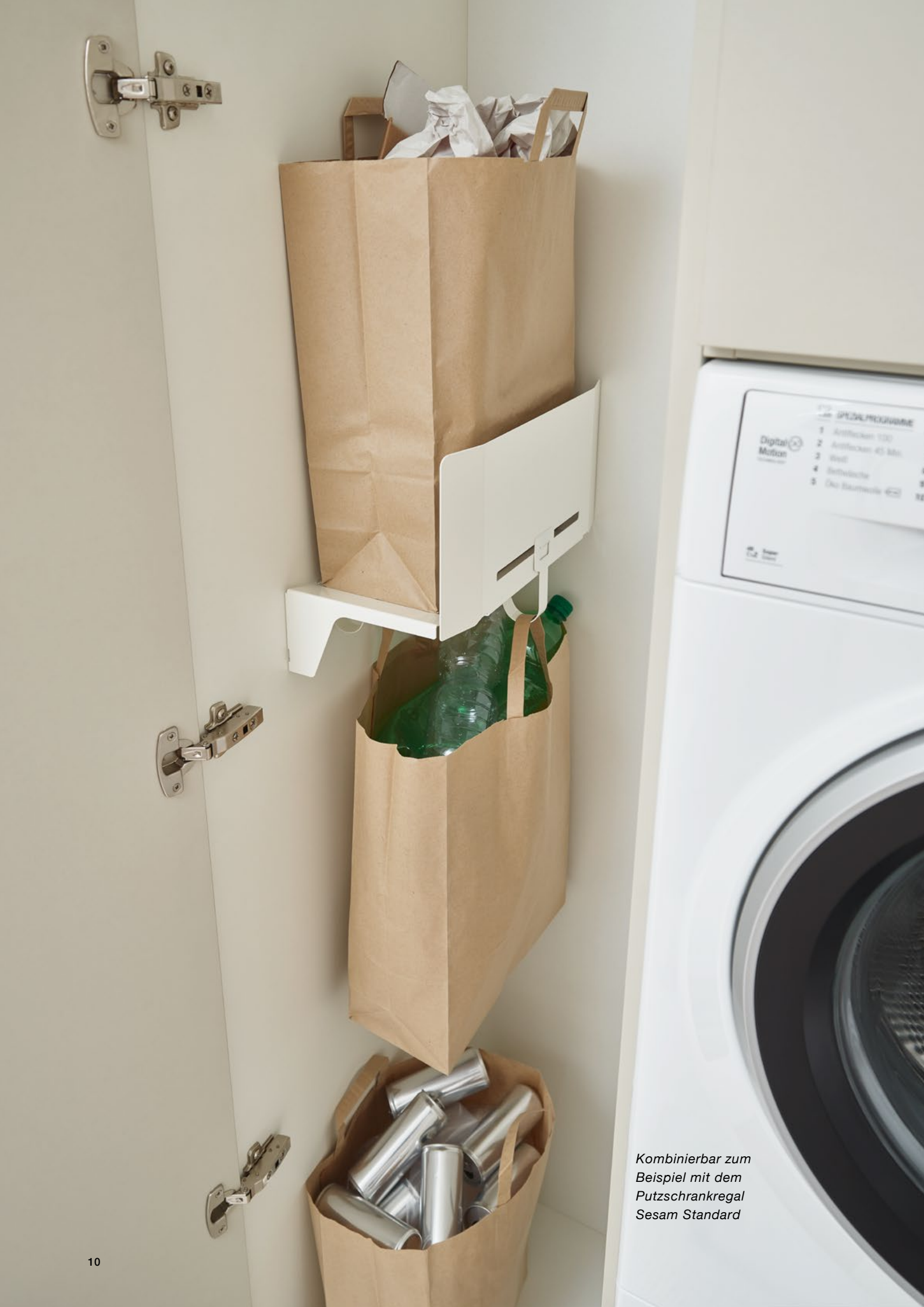
Kombinierbar zum Beispiel mit dem Putzschrankregal Sesam Standard